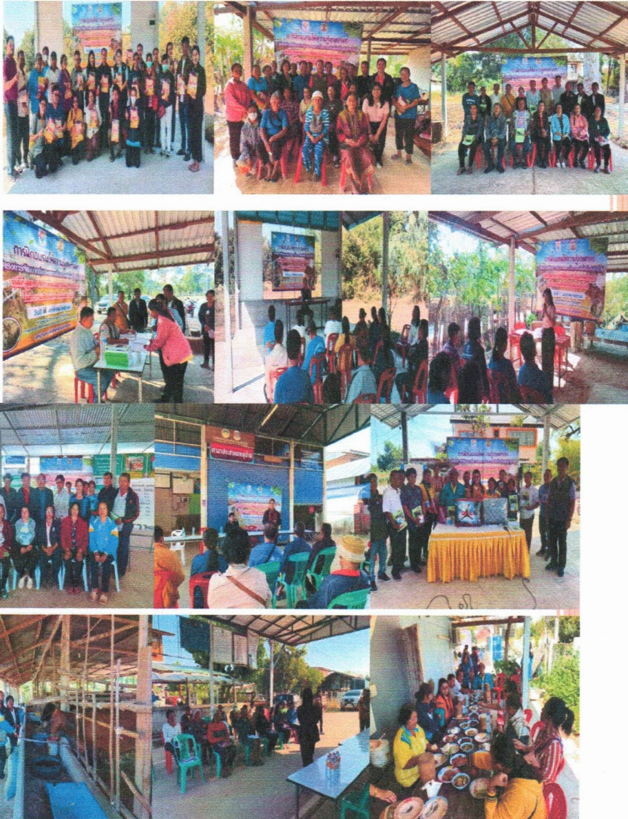
มติที่ประชุม รับทราบ

งบประมาณ ๗๐๗,๗๐๐ บาท ดำเนินการในพื้นที่ อ.เมืองร้อยเอ็ด, อาจสามารถ, เกษตรวิสัย, รัชบุรี, ปทุมรัตน์, สุวรรณภูมิ, โพธิ์ชัย, ท่งเขาหลวง, เมยวดี และเมืองสรวง โดยทางสำนักงานปศุสัตว์อำเภอ ดำเนินการฝึกอบรมเกษตรกร อำเภอละ ๒๐ คน รวม ๒๐๐ คน ระหว่างวันที่ ๖ - ๑๗ มกราคม ๒๕๖๘ เรียบร้อยแล้ว