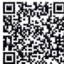
QR code รายงานอาการไม่พึงประสงค์รายฟาร์ม