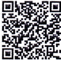
QR code รายงานอาการไม่พึงประสงค์รายอำเภอ

๔. รายงานผลการฉีดวัคซีนป้องกันโรคระบาดสัตว์ (กคร. ๕) ไปยังสำนักงานปศุสัตว์จังหวัดร้อยเอ็ด ภายในวันอังคารที่ ๒๘ กุมภาพันธ์ ๒๕๖๖รายละเอียดตามเอกสารที่แนบมาพร้อมนี้