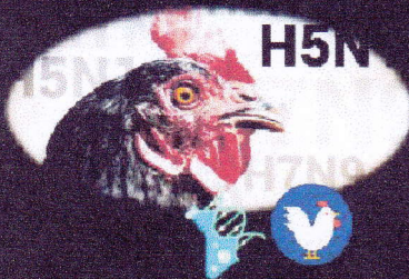
มาตรการควบคุม ป้องกันโรคไข้หวัดนกชนิดรุนแรงต่ำ

- ทำความสะอาดและทำลายเชื้อโรคในฟาร์ม วัสดุอุปกรณ์ฟาร์ม